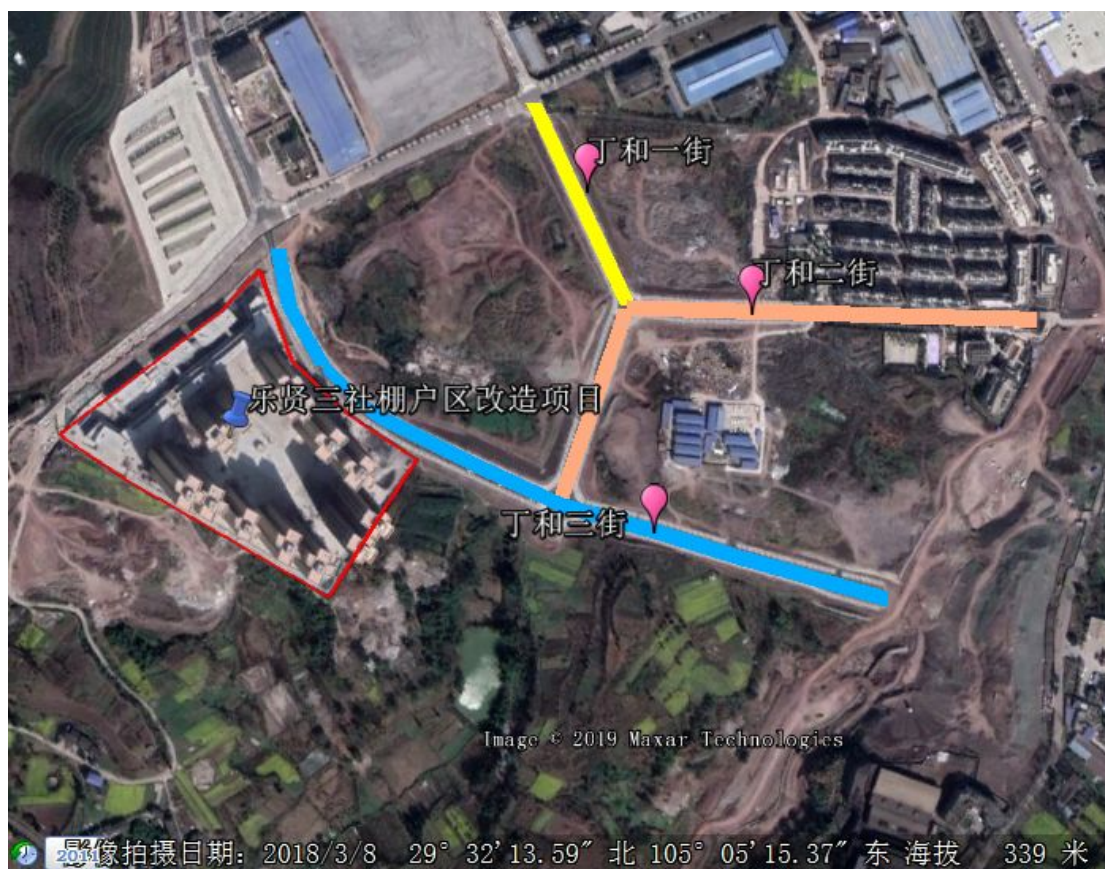
图 1-2 本项目与丁和 123 街项目相对位置图

根据调查本项目施工资料和竣工资料（竣工结算书），工程实际建设土石方来自场平、基础开挖与回填、表土综合利用等项目区场地地坪高程为349.00~349.30m。项目土石方开挖总量15.33万m 3 （含表土剥离1.20万m 3 ），回填利用45.94万m 3 （含绿化覆土1.20万m 3 ），外借土石方30.61万m 3 ，其中从“内江市城南新区丁和一街、二街、三街道路工程”外借土石方10.71万m 3 ，此外从其他区域外购土石方19.90万m 3 ，工程建设不对外产生弃土，不涉及取料场，不涉及弃渣场。