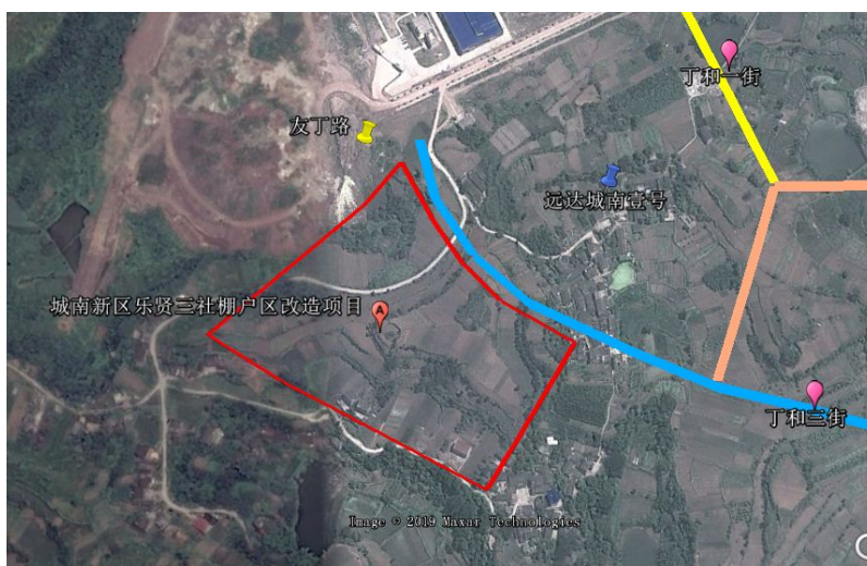
图 1-1 工程地理位置图（原始地表）

内江城南新区乐贤三社棚户区改造项目位于内江市市中区乐贤四社、丁和九社境内，友丁路以南，丁和三街以南的区域，场址中心地理坐标为 N29°32'14.68"，E105°04'54.66"。工程建设场址海拔高程为 331.00~364.00m，原始地表相对高差约 33m，原始地表主要覆盖耕地、住宅用地和其它林地。